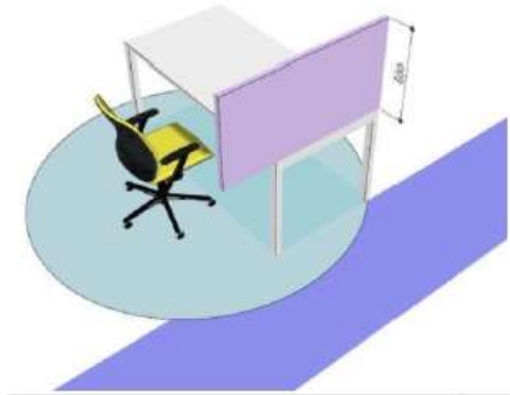
Figura 2 - Postazione di lavoro singolo

In linea generale se l'area di passaggio è effettivamente usata come passaggio, senza permanenza, quindi, di visitatori nella zona adiacente alla scrivania, l'adozione di schermi protettivi non è ritenuta necessaria; tuttavia se si ritiene che l'operatore seduto alla scrivania singola isolata possa essere esposto a rischi derivanti dalla presenza di un'area di passaggio adiacente, è possibile valutare l'aggiunta di uno schermo di altezza \geq (600\pm 20) mm a partire dal piano di lavoro come illustrato in figura: